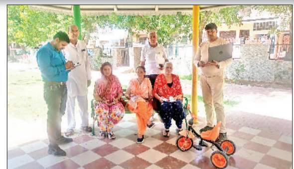
रोहतक। सेक्टर 14 में पहुंचे नगर निगम के कर्मचारी डाटा अपलोड करते हुए।

नगर निगम के लिए प्रॉपर्टी आईडी रिकार्ड दुरुस्त करना, प्रॉपर्टी की जानकारी यूएलबी पोर्टल पर अपलोड करवाना टेढ़ी खीर बनता जा रहा है। कई माह से चल रहे अभियान के बावजूद महज 30 हजार लोगों ने पोर्टल पर संपत्ति की जानकारी दी है। इसके अलावा अभी भी एक तिहाई आबादी के बिल गलत बने हुए हैं। इस चुनौती से निपटने के लिए निगम ने कर्मचारियों को घर घर भेजने का निर्णय लिया है।